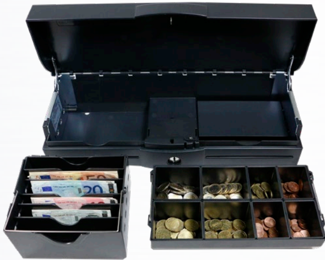
Entnehmbare Münz- und Noteneinsätze